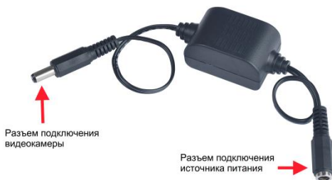
Рис.1 GL001HP Внешний вид. Разъемы подключения.